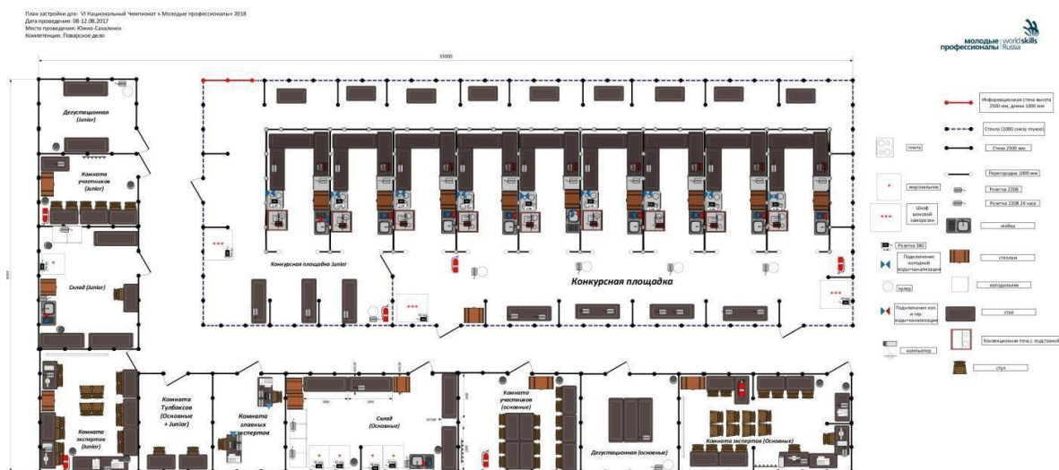
Схема конкурсной площадки (см. иллюстрацию).